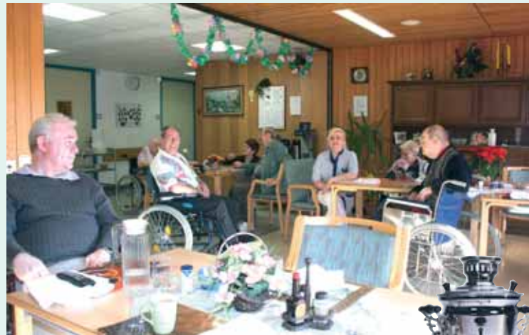
Gemütliches Wohnzimmer (уютный зал)