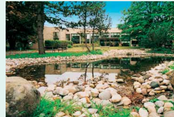
Hauseigener Park mit Teich (парк)