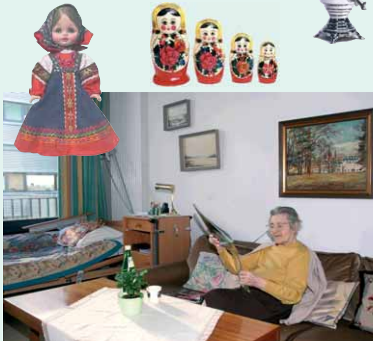
Individuell eingerichtete Zimmer (обстановка комнаты по своему вкусу)