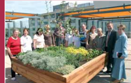
Hochbeet mit Sinnen anregende Bepflanzung auf der Dachterrasse